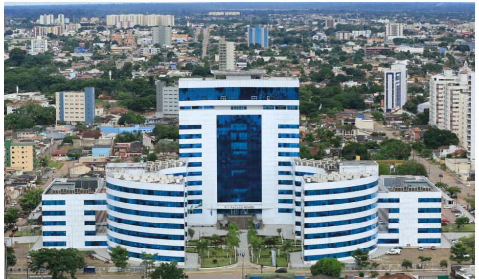
Estado ficou atrás apenas do Tocantins, que cresceu 11,1% em 2023

Ações de incentivo garantem fortalecimento da agricultura familiar em Rondônia