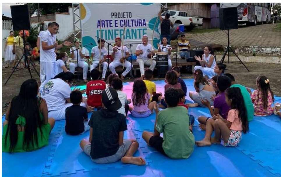
A Funcultural convida a população de Vista Alegre para o evento

A Funcultural convida a toda a população de Vista Alegre para o evento, a partir das 17h, na avenida Governador Jorge Teixeira, no Centro do distrito, onde novas edições em outros distritos serão divulgadas para a população.