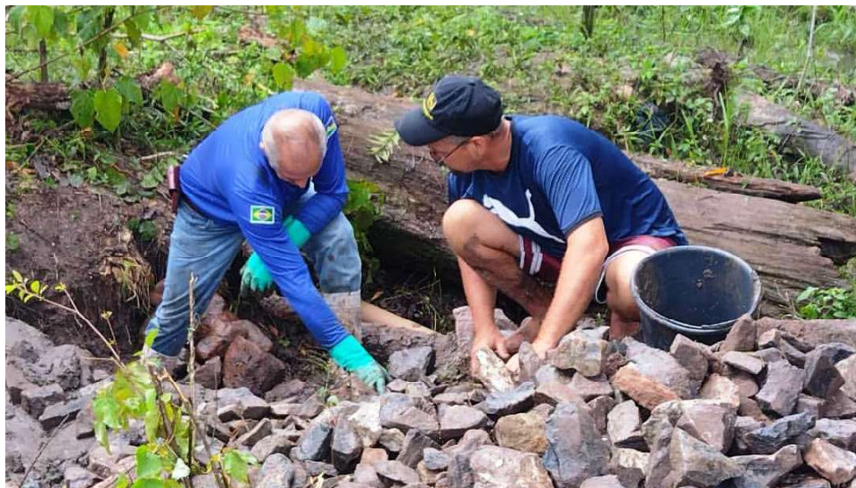
Equipe realiza envelopamento com pedras rachão para, em seguida, isolar a área e recompor a mata ciliar