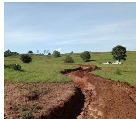
Construção de curvas de nível visa frear o processo de erosão

à recuperação de nascentes e plantio de mudas de árvores nativas e demais espécies de fácil adaptação com a região, a fim de recuperar as bacias dos rios atingidos. “Para isso pretendemos mobilizar as partes envolvidas, para que realizem reuniões com os proprietários rurais que estão na área de abrangência do projeto, visando a sensibilização e adesão às ações de recuperação e conservação das microbasias dos rios, que estão sendo prejudicados com o fenômeno El Niño e as mudanças climáticas”, concluiu.