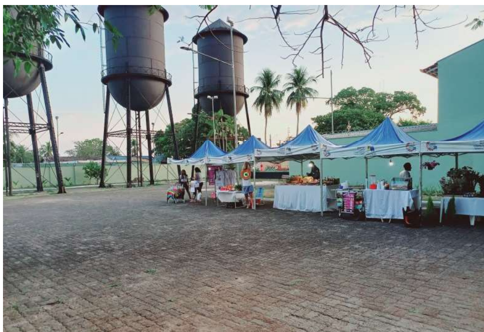
Ação visa fomentar a economia solidária e o empreendedorismo

O Giro Empreendedor é mais uma ação da Prefeitura de Porto Velho para fomentar a economia solidária e o empreendedorismo, acontece semanalmente e oportuniza crescimento de vendas de pequenos negócios locais.