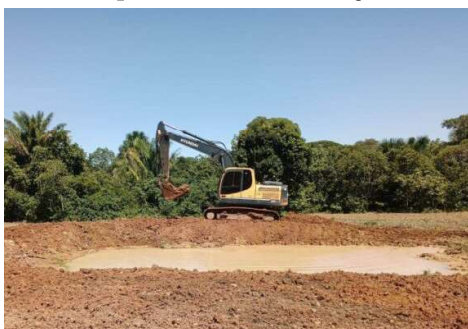
Implantação de barraginhas e subsolagem na microbacia do rio Palmeira, em Espigão d'Oeste

O município de Cerejeiras foi contemplado com o repasse financeiro para recuperação das nascentes e matas ciliares da bacia do rio Araras. O projeto conta com a parceria da Prefeitura de Cerejeiras, e visa restaurar quase 200 cursos de água do rio