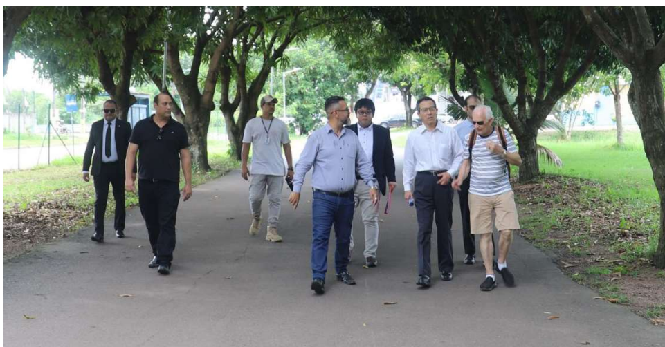
Assessores técnicos da Sema e moradores do bairro acompanharam a visita do Cônsul geral japonês no Skate Park

investidos U$ 2,8 mil (dólares americanos), que à época correspondiam em reais a R$ 55 mil, por meio de um programa de assistência a projetos comunitários do governo japonês. O intuito é promover a saúde, educação e água potável para os brasileiros que moram na região do parque, através da iniciativa da associação de moradores, que pretendiam transformar o local em um espaço de lazer.