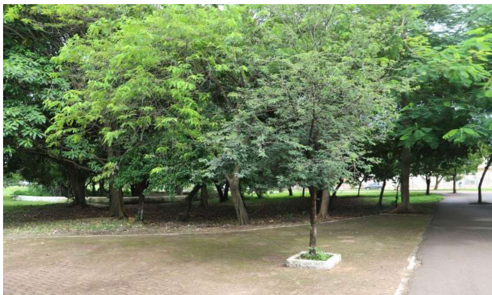
O cônsul observou as melhorias feitas no parque nos últimos anos

“A gente participou do projeto de limpeza (havia muito lixo no local) e plantamos as primeiras árvores. Quando vejo isso aqui, a gente fica muito feliz porque aquele sonho lá atrás se tornou realidade, e hoje, todos podem aproveitar, inclusive os nossos filhos”, comentou.