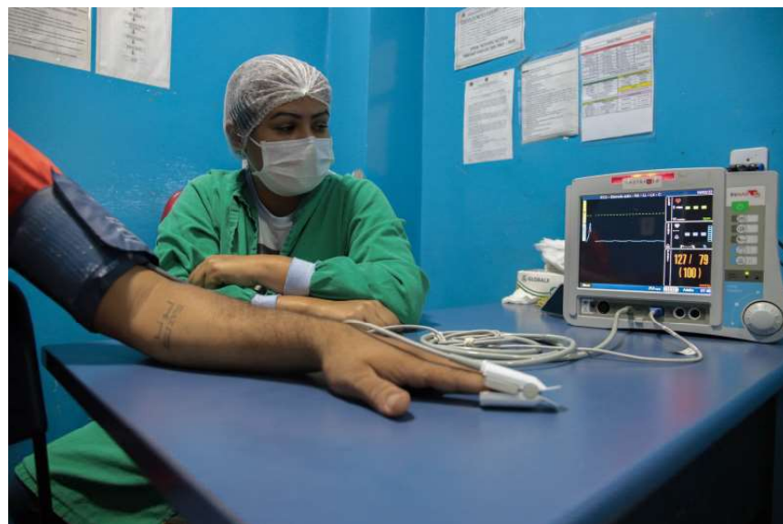
A coleta desses testes se inicia na rede pública municipal de saúde

O Ministério da Saúde informa ainda que não existe tratamento específico para a doença. A recomendação é que o paciente que