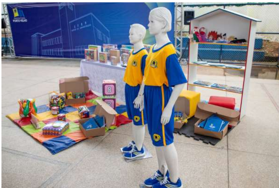
Mais de 43 mil alunos receberão o kit escolar

mochilas e tênis, a Prefeitura de Porto Velho, através do Programa de Saúde na Escola (PSE), também a entrega do kit de saúde bucal, continuidade do programa of-