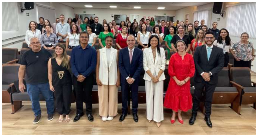
Desembargador Álvaro Kalix Ferro destacou os desafios do combate a violência para rede de enfrentamento e estudantes

gem mais simples e pedagógica, o magistrado se dirigiu aos estudantes do ensino médio da rede estadual, uma sensibilização que busca plantar a semente da cultura de paz e ressignificação da violência. Durante a abordagem, estudan-