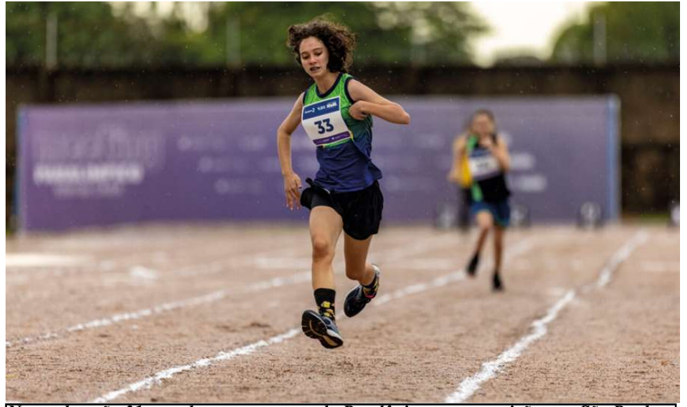
No total, serão 31 paratletas representando Rondônia nas competições em São Paulo

Na modalidade atletismo, foram 19 paratletas distribuídos nas categorias de 100m; 200m; arremesso de peso; lançamento de dardo; lançamento de disco; lançamento de pelota e distância. Já na modalidade de natação, quatro competidores participaram das categorias 50m e 100m livre; 50m e 100m peito; 50m e 100m costas; 400m livres; e 100m borboleta.