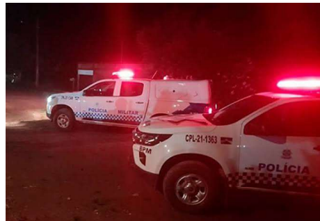
Polícia fez buscas aos bandidos modelo Toyota Corolla das vítimas e fugiram. A PM ainda fez buscas, mas nenhum suspeito foi localizado.

Depois os bandidos colocaram vários objetos como uma TV de 60 polegadas, celulares e outros objetos dentro de um carro