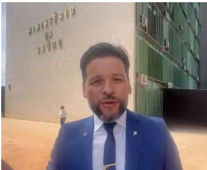
Para o deputado estadual, a saúde do povo de Rondônia está abandonada pelo governo federal desde o início do atual mandato

O Delegado Camargo quer saber por que o Estado de Rondônia foi