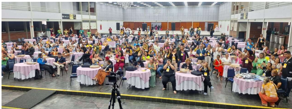
A formação contou com a participação de cerca de 750 professores

O objetivo é oferecer às comunidades de difícil acesso, e com demanda reprimida, melhores condições de cidadania, de trabalho e de inclusão social aos estudantes desse segmento populacional. O Projeto propõe atender o Ensino Médio com metodologia