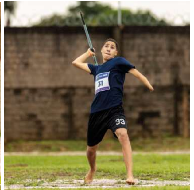
No atletismo foram 19 paratletas participantes.