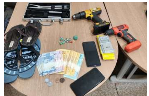
Junto com o acusado os policiais encontraram drogas, dinheiro trocado e produtos oriundos de furtos

Um homem foi preso na tarde de quinta-feira (07), no bairro Cidade Alta em Rolim de Moura. A prisão foi feita por equipes da PATAMO, PTRAN e PC por tráfico de drogas.