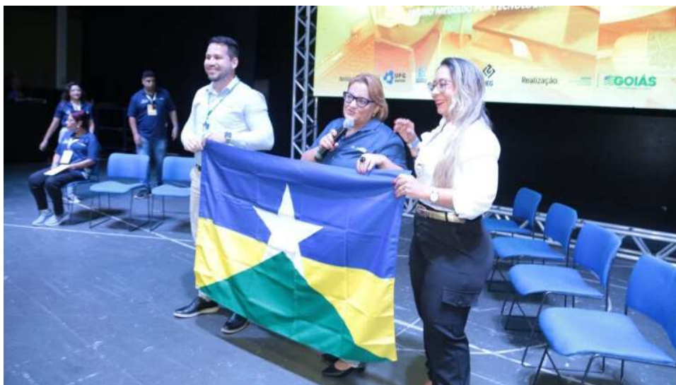
A proposta é atender o Ensino Médio com metodologia inovadora

Conforme destacado pelo Governo de Rondônia, é direito de todo e qualquer estudante ter acesso à educação, seja onde estiver. O propósito de existência da Mediação Tecnológica é atender justamente a esse direito.