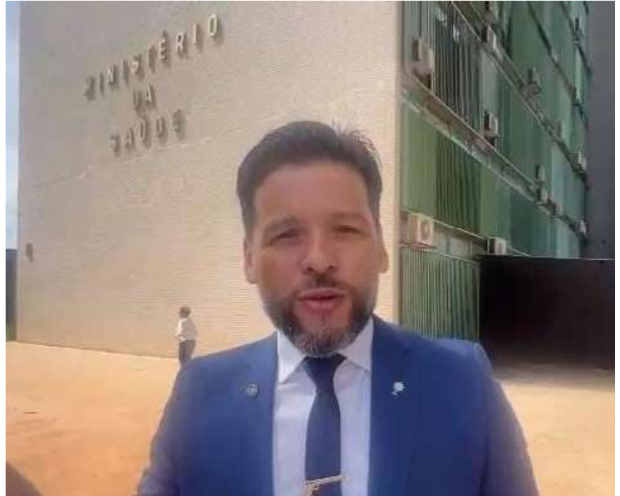
Deputado quer que Rondônia seja respeitada e, assim como os demais estados, receba a vacina contra a dengue.