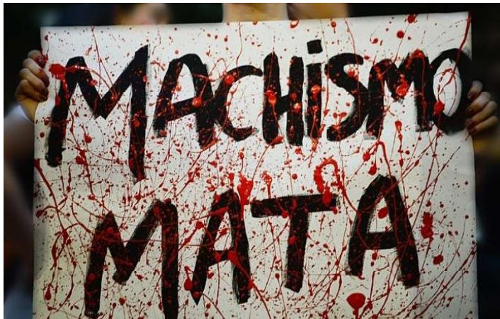
A única região que apresentou redução de feminicídio foi o Sul

Segundo a pesquisa, 18 estados apresentaram taxa de feminicídio acima da média nacional no ano passado, de 1,4 mortes para cada grupo de