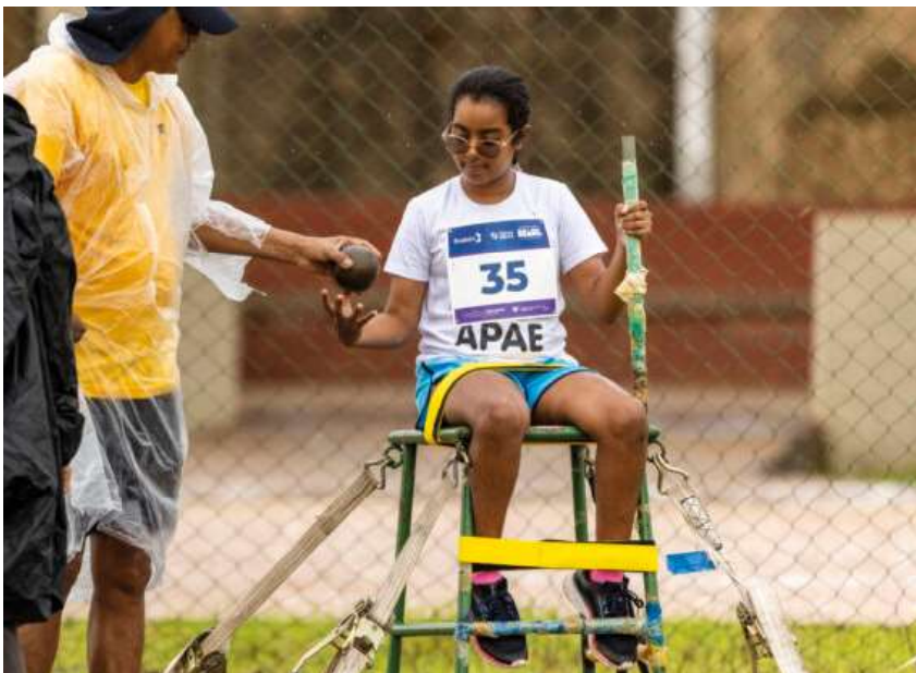
A Seduc tem um trabalho de ação continuada de inclusão social