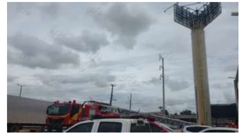
Trabalhadores estavam realizando um serviço de pintura no interior da caixa d'água

O Corpo de Bombeiros fez o resgate de dois trabalhadores que passaram mal em uma caixa d'água. O incidente ocorreu no começo da tarde desta sexta-feira (8), em um supermercado localizado na Rua Raimundo Cantuária, próximo à Avenida Marmoré, na zona leste de Porto Velho (RO).