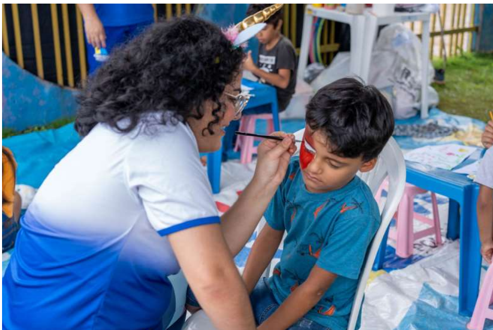
Semes iniciou as atividades do Projeto Rua de Lazer deste ano no distrito