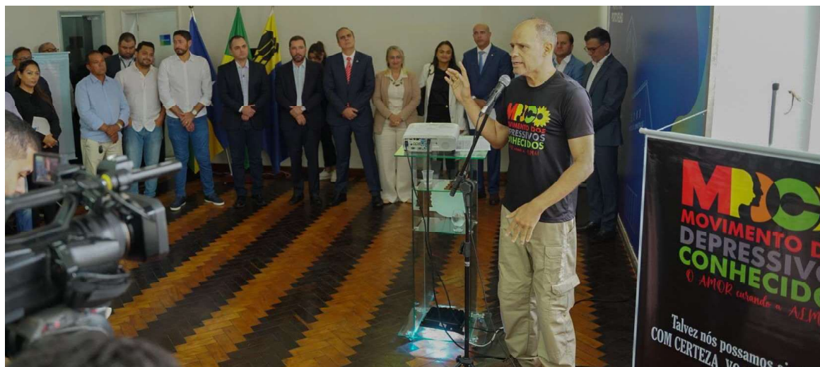
Encontro O amor curando a alma aconteceu na sede da prefeitura de Porto Velho