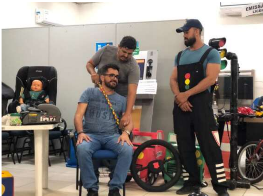
A oficina foi um espaço para aprimorar a linguagem da abordagem na Educação Infantil