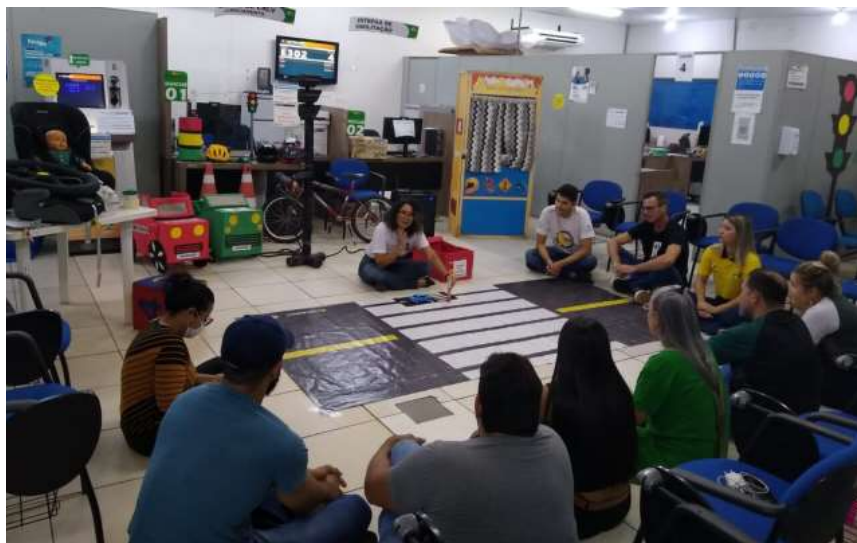
Oficina para aprimorar técnicas de trabalho na Educação de Trânsito aconteceu na Ciretran de Ji-Paraná.