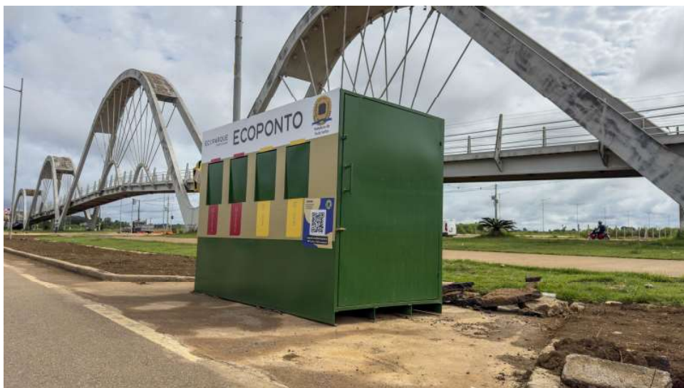
Ecopontos estão sendo instalados em diversas zonas da cidade

ciais urbanos. Uma vez que o intuito do projeto da coleta seletiva solidária, juntamente com esses ecopontos, é arrecadar a maior quantidade possível de materiais recicláveis e ofertar para a população do município uma possibilidade de ter essa cultura, essa prática mais sustentável, essa prática de descarte correto dos materiais”, explicou o secretário adjunto.