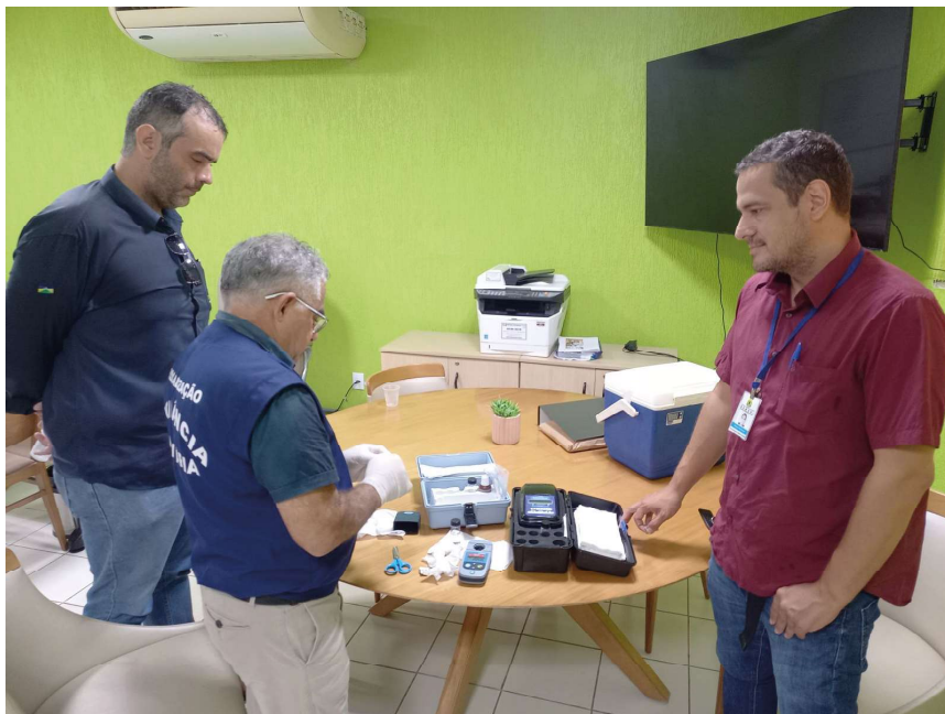
Trabalho consiste em avaliar a qualidade da água consumida pela população

“Quando identificado irregularidades na água o estabelecimento é notificado tendo um prazo de 15 dias para se regularizar. Após isso, o fiscal vai in loco, nova-