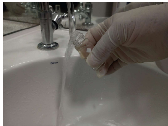
Em 2023, foram coletadas aproximadamente 1.350 amostras para análise de controle da qualidade da água

ber, sem se preocupar com possíveis doenças. Vejo que é um trabalho realizado constantemente e que não deixa a desejar. Estou muito satisfeita e grata por ter água potável em minha casa”, diz Eliane.