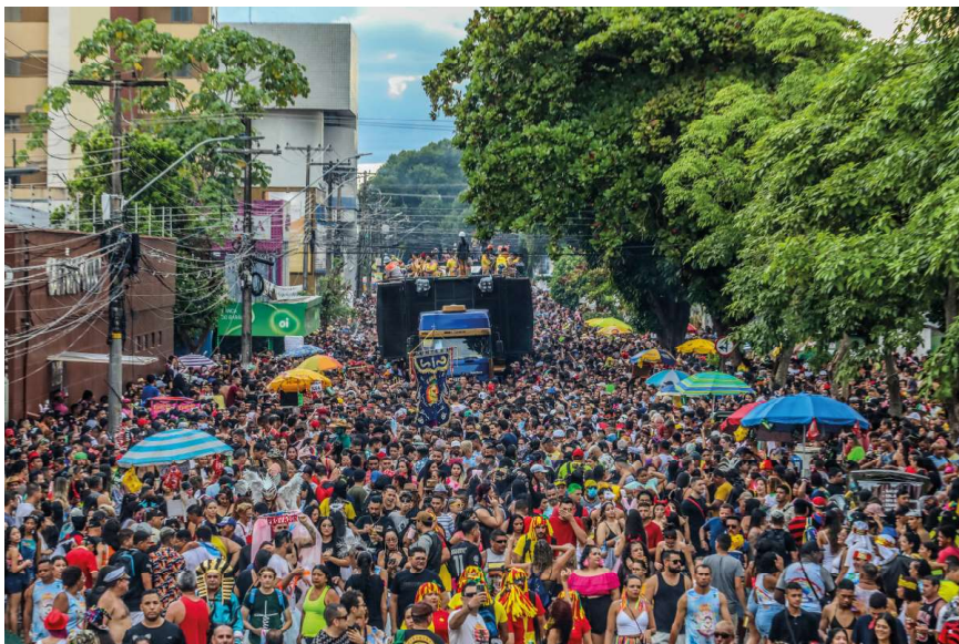
Blocos Canal Remix, Axé Folia e Leste Folia encerram o carnaval na capital

Fica proibido, de acordo com a portaria, o trânsito e estacionamento de veículos, inclusive caçambas estacionárias, conhecidas como papa-entulho, nos circuitos dos desfiles dos blocos carnavalescos neste ano. O documento também especifica horários, dias e o percurso a ser feito pelos foliões. Apenas veículos com Autorização Especial de Tráfego (AET) ficam isentos desta portaria. “O motorista que não obedecer às normas estabelecidas pela portaria poderá ter o veículo removido e ainda sofrer as sanções que estão previstas no Código de Trânsito Brasileiro (CTB), que é a Lei nº 9.503 de 23 de setembro de 1997”, completou o se-