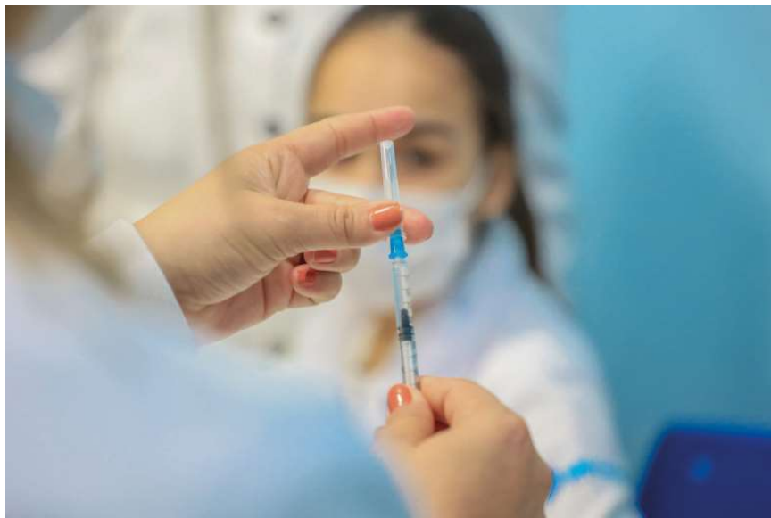
A vacina contra a influenza está disponível nas unidades de saúde

A vacina contra a influenza está disponível para todos os cidadãos acima de seis meses de idade nas unidades de saúde da capital, zona rural e distritos. Pessoas que fazem parte de grupos de risco, como gestante, puérpera, idoso, imunocomprometido, entre outros, devem se identificar ao vacinador no ato da imunização.