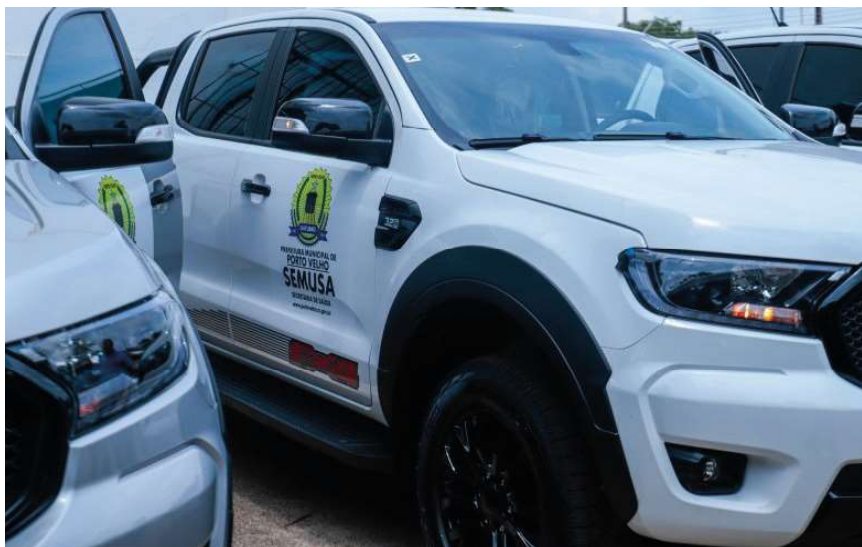
Emenda parlamentar será gerenciada pela prefeitura de Porto Velho

A emenda de R$ 330 mil foi liberada pelo poder executivo estadual e repassada à prefeitura de Porto Velho, que vai ficar responsável pela gestão e aquisição de uma caminhonete 4x4 para atender o distrito nos