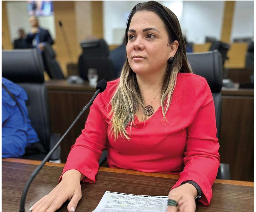
De acordo com a deputada, são investimentos para oito cidades e várias regiões de RO

As obras de pavimentação e recuperação de estradas vicinais contemplam municípios como Rolim de Moura, Urupá, Seringueiras, São Francisco do Guaporé, Cacoal, Cujubim, Primavera de Rondônia e Porto Velho. O mercado municipal da capital rondoniense também passará por um processo de reforma.