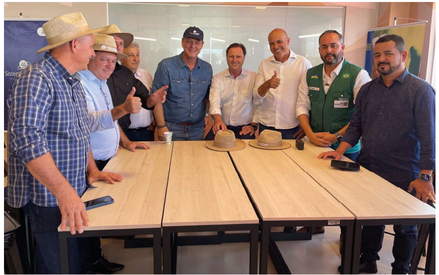
Deputado integrou comitiva rondoniense em evento no Paraná

ativa de todos os envolvidos na reunião reflete um compromisso compartilhado com o avanço do setor agrícola em