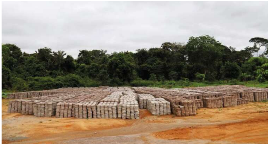
Prefeitura de Ariquemes utiliza mão de obra reeducanda na