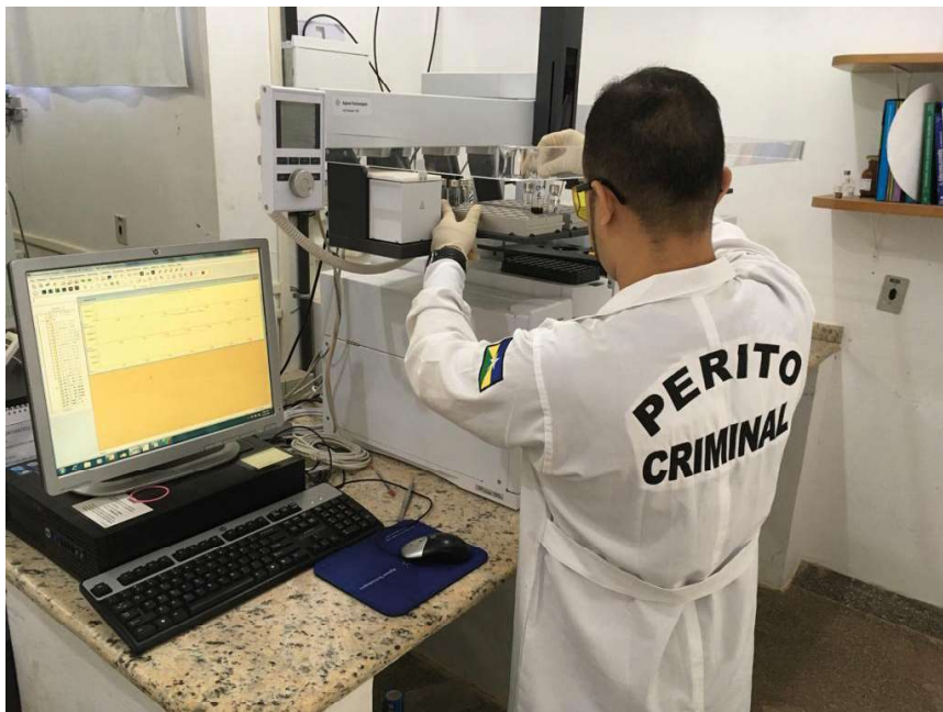
Os 30 peritos criminais e 30 agentes de criminalística nomeados atuarão nos campos da perícia criminal e da investigação científica.