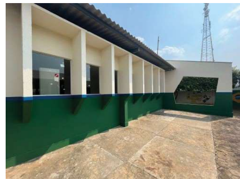
Defesa Civil segue com trabalho de monitoramento e orientação à população

Todas elas receberam alguma obra de infraestrutura que vão desde pintura geral das unidades à substituição de peças, reforma do telhado e/ou instalação de calha d'água e transformador de energia.