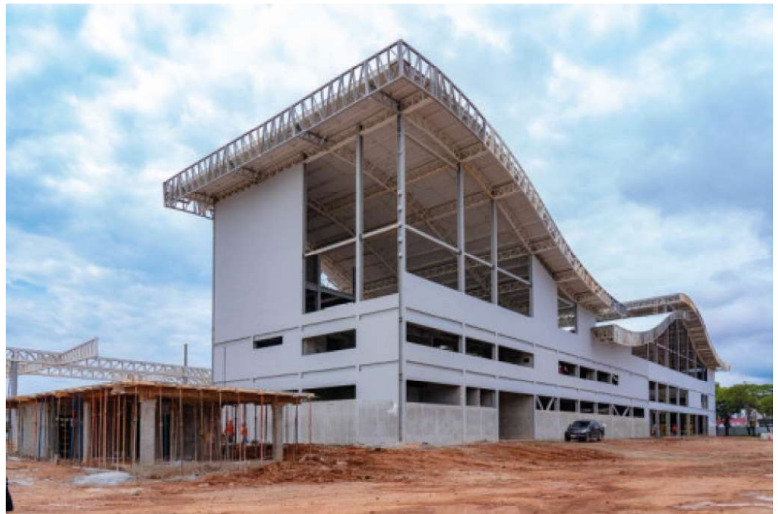
Os atendimentos do Samu funcionam 24h todos os dias da semana

Emenda de R$ 1 milhão é liberada para cascalhamento de estradas em Buritis