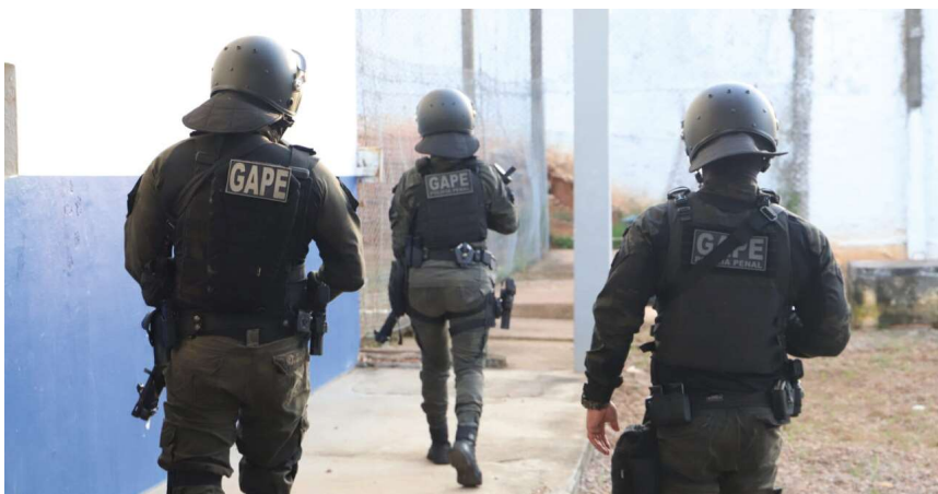
A ação foi realizada por policiais penais do GAPE, um cão farejador e um representante da Senappen.

O Governo do Estado reforça o avanço em termos de segurança pública e destaca as ações da Polícia Penal, que fortalece o alinhamento com operações nacionais, impulsionando o combate à criminalidade no Estado, pontuando as