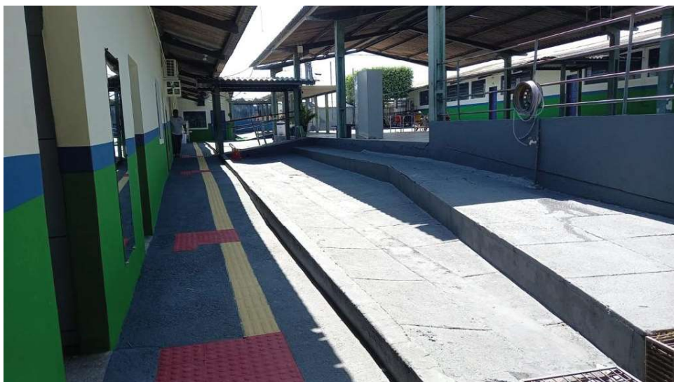
Defesa Civil segue com trabalho de monitoramento e orientação à população

Entre as escolas que tiveram os serviços concluídos está a Escola Estadual Antônio Francisco Lisboa. A unidade recebeu o serviço de pintura em toda a área interna e externa, construção de cobertura, instalação elétrica e forro. As escolas estaduais Anísio Teixeira, Professora Carmem Ione de Araújo e Ricardo Catanhede também foram contempladas com a pintura interna e externa, instalação elétrica e pavimen-