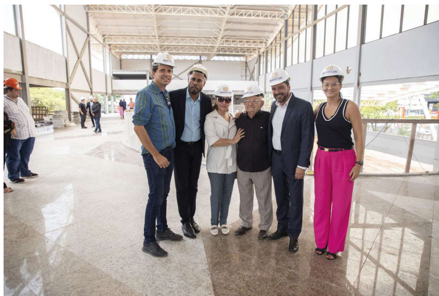
Motocicletas de até 170 cilindradas estão isentas desde o início do ano.

A nova rodoviária conta com investimento de R$ 44 milhões, sendo R$ 22 milhões dos cofres da Prefeitura e outros R$ 22 milhões de emenda da ex-deputada federal Mariana Carvalho.