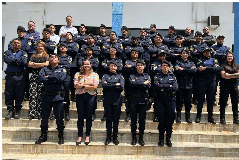
Guarda Civil de Ariquemes em mais uma capacitação para atender à população

A Secretaria Municipal de Segurança e Trânsito de Ariquemes - SEMUST, através da Guarda Civil Municipal - GCM, participa durante esta semana (de 23 a 27), de um curso nacional de Atendimento à Pessoa Idosa, com o tema “O papel dos profissionais de segurança pública no enfrentamento à violência contra a pessoa idosa”.