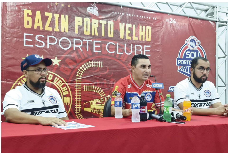
Diretoria falou de planejamento e investimentos também para o futebol da base

O Porto Velho realizará a última seletiva no sábado, dia 22, às 14h, em Porto Velho, para dar oportunidade a atletas de bairros populares da capital, como Orgulho do Madeira e Morar Melhor. (Aline Rodrigues).