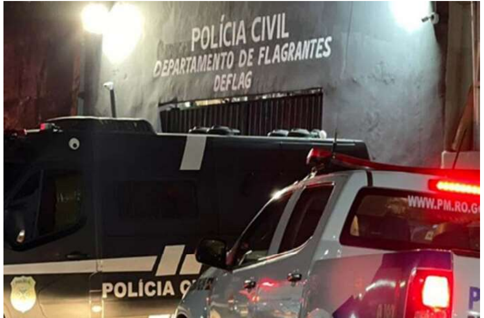
mulher foi levada para a central de Flagrantes para acalmar os ânimos e falar com o delegado de plantão.

Já na presença dos policiais, a mulher atacou o marido com vários socos, tapas no rosto e acabou presa em flagrante. A acusada foi levada ao Departamento de Polícia Civil.