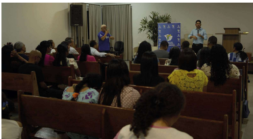
Ano letivo da escola dos deputados terá início neste mês.