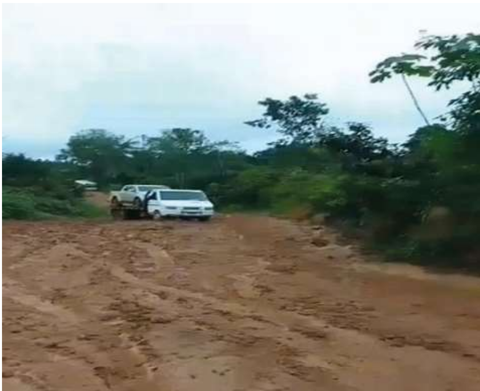
Estrada está intrafegável, oferecendo risco à população

Camargo pede urgência ao DER neste atendimento para que o escoamento da produção agrícola das propriedades rurais da região possa ser feito sem risco de acidentes e para que os estudantes das redes municipal e estadual não percam aulas em função da falta de trafegabilidade.