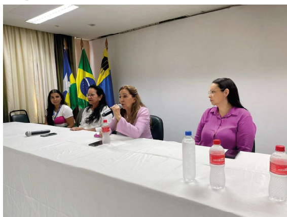
Encontro discutiu as novas políticas de prevenção e tratamento da hanseníase

Para ter acesso ao serviço de hanseníase, basta procurar as unidades de saúde da família de Porto Velho com cartão do SUS e documento com foto.