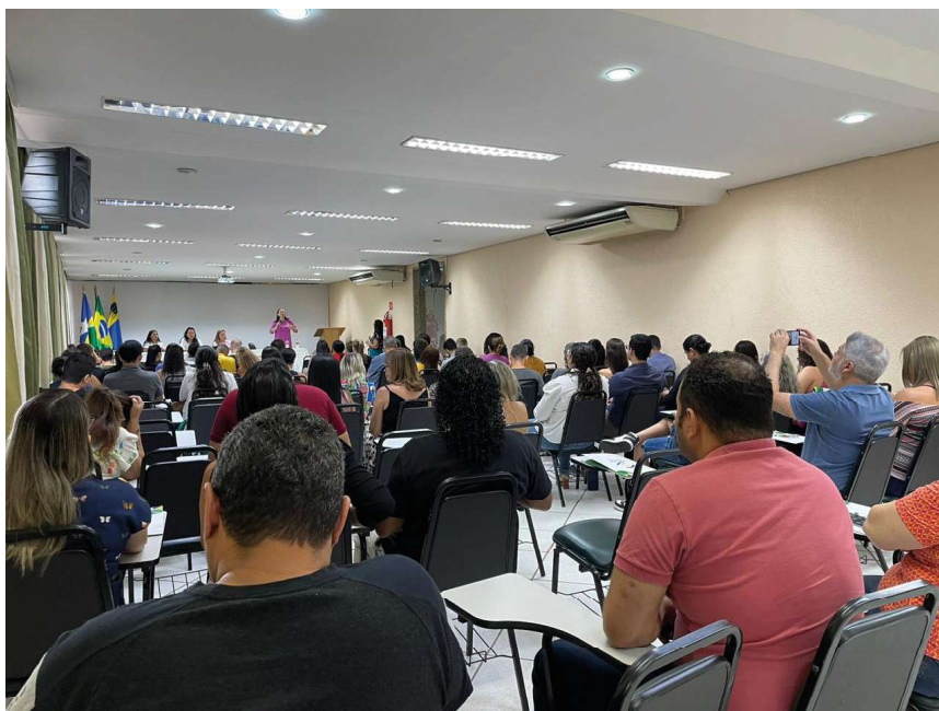
Encontro discutiu as novas políticas de prevenção e tratamento da hanseníase