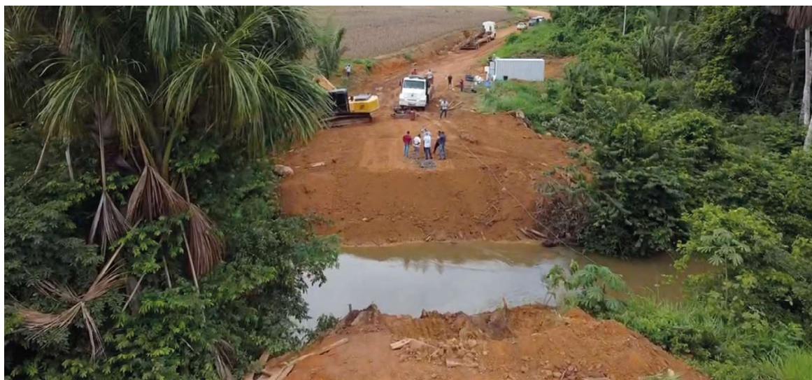
Travessia é uma reivindicação antiga dos moradores que vai se tornar realidade

Esta nova ponte, uma estrutura de madeira de lei com bate estaca e extensão de 25 metros, representa um investimento significativo na região. O projeto, avaliado em R$ 590.438,00, é financiado majoritariamente por uma emenda parlamentar do deputado Fernandes, com um valor de R$ 459.000,00, enquanto a contrapartida municipal é de R$ 131.438,00. “Estou extremamente or-