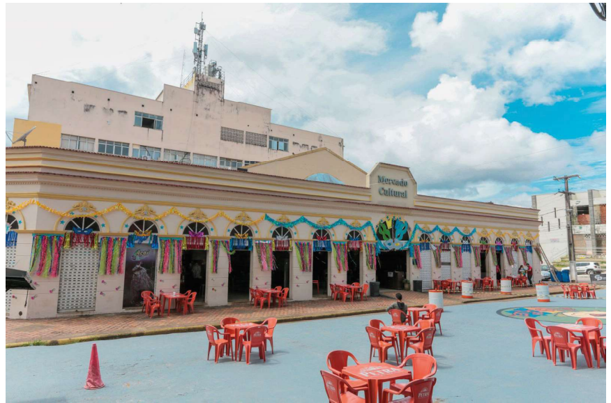
O Circuito Manelão será lançado no Baile Municipal,

O Circuito Manelão será lançado no Baile Mu-