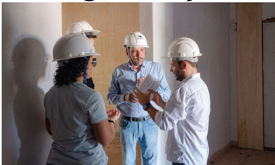
Mais 3,6 mil metros quadrados com melhorias na estrutura física, hidráulica e elétrica

Ao todo, 3,6 mil metros quadrados estão em obras com melhorias na estrutura física, hidráulica e elétrica. O centro cirúrgico passa por reformas. Além disso, estão sendo construídas mais três enfermarias. A unidade também ganhará uma sala de emergência com posto de enfermagem para atendimento das gestantes, ampliação da sala de cuidados de atenção