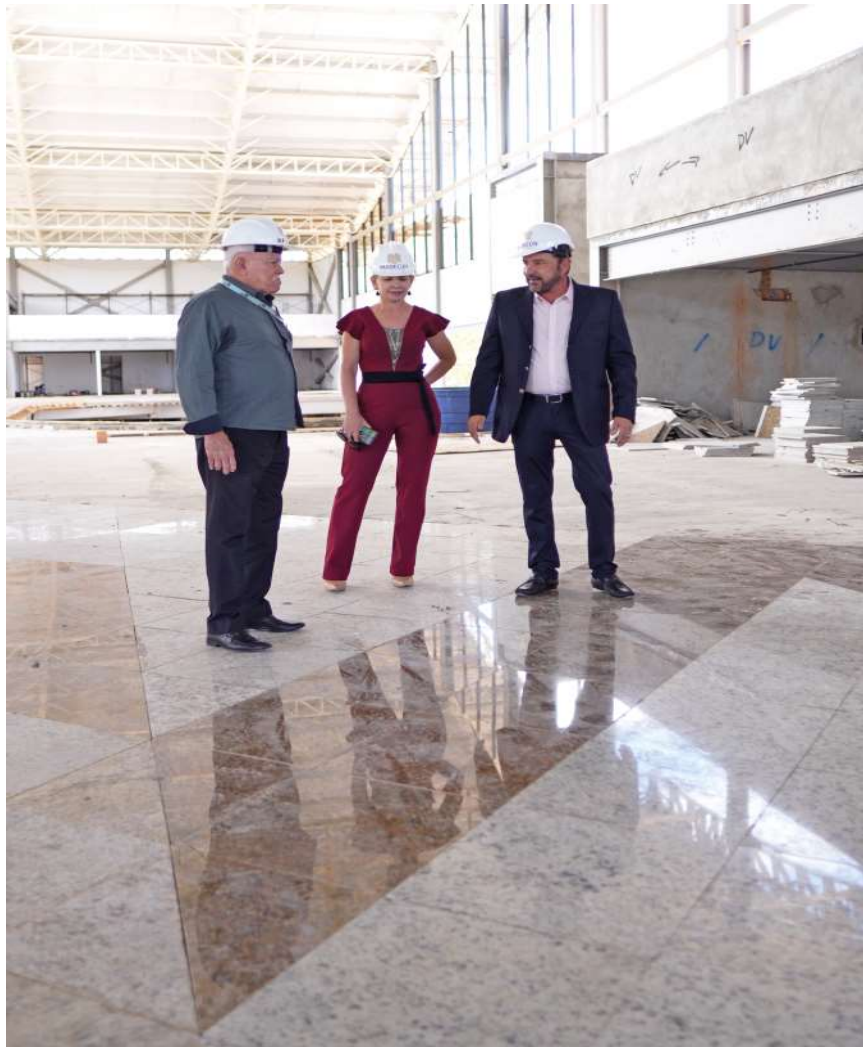
Obra está com o cronograma bastante adiantado

O prédio foi projetado para valorizar aspectos e elementos da natureza local e da cultura amazônica, com a fachada que remete ao rio Madeira e ao tom amadeirado que faz menção às árvores da região. Já a instalação do piso dá uma repre-