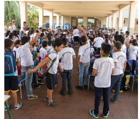
Rede estadual conta com mais de 200 mil alunos matriculados

A secretária também confirmou a manutenção das escolas com administração militarizada, mas com comando e professores civis, decida pelo próprio governo Marcos Ro-