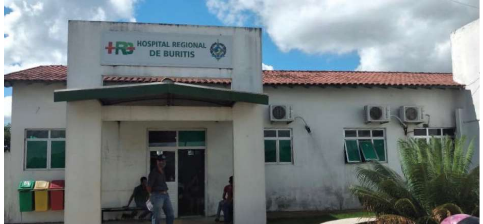
Hospital de Buritis atende à população dos municípios da região do extremo oeste

A reforma realizada pela Secretaria de Obras e Serviços Públicos