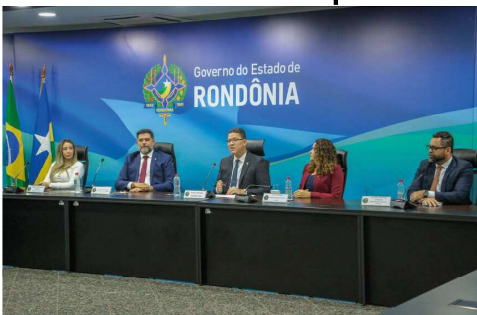
Governo de Rondônia tem vários projetos para o desenvolvimento do estado

O mesmo vai acontecer com os demais Poderes, que também dependem da abertura oficial do orçamento, para receberem os valores referentes às cotas que têm direito, para o cumprimento dos seus compromissos, incluindo-se aí o pagamento dos salá-