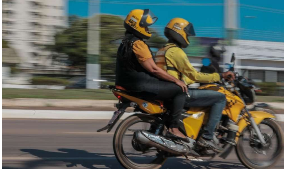
Medida visa apoiar aqueles que dependem de seus veículos para o sustento diário

“A nova lei de isenção de IPVA é um testemunho de nossa dedicação aos valores que defendemos para favorecer as pessoas que mais precisam, que no caso são aqueles que usam seus veículos no dia a dia do trabalho.”