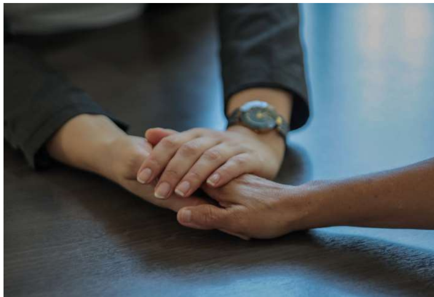
Prefeitura de Porto Velho levará ações de reflexão para as unidades prisionais da capital

O grupo também levará um momento de descontração para as reeducandas do presídio feminino com uma aula de dança. “A professora já participou anteriormente de