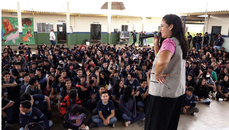
As palestras foram focadas na prevenção e cuidados com a limpeza dos quintais