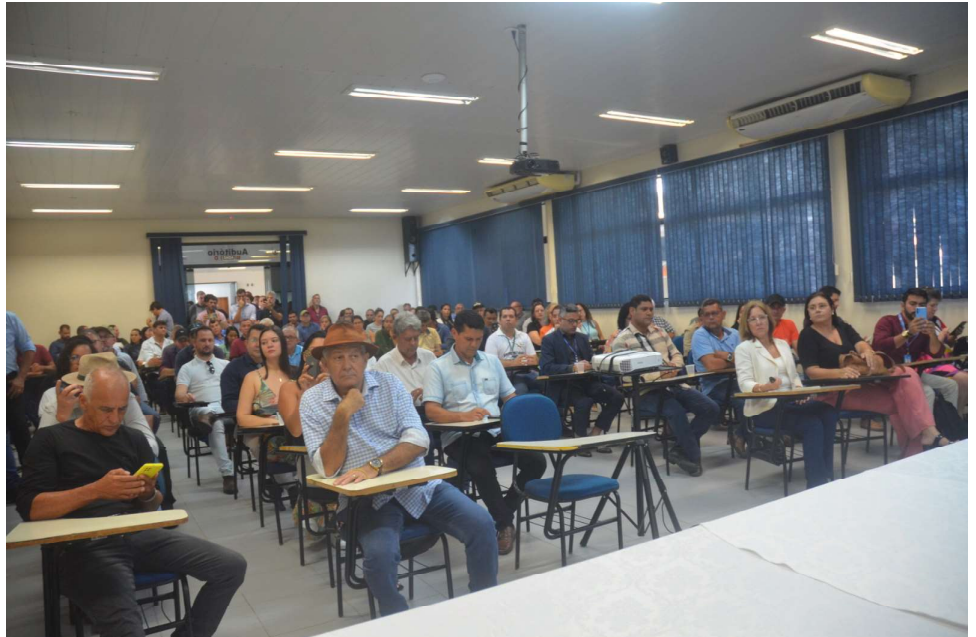
Entidade já conta com a participação de 20 municípios