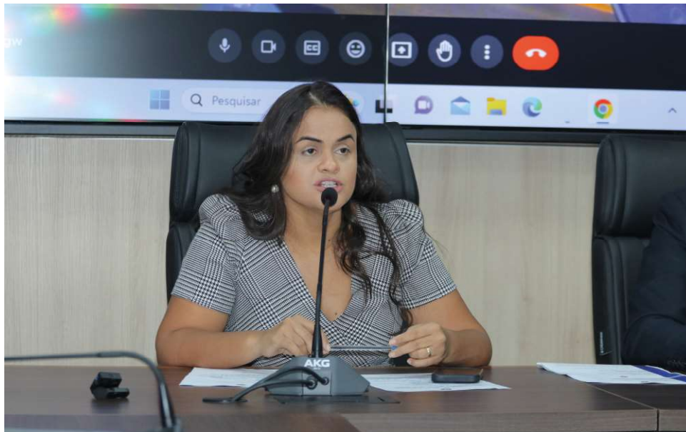
Comissão acompanha o caso de perto, buscando justiça e medidas efetivas para proteger as crianças do estado.

“Vamos emitir uma nota de repúdio a esse ato repugnante. É nossa responsabilidade, através da Comissão, promover ações que protejam nossos filhos. Nós, como legisladores, precisamos tra-