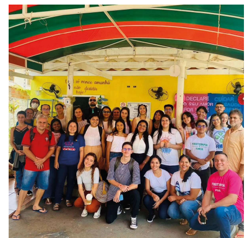
Alunos do projeto Fazer o Bem Sem Olhar a Quem