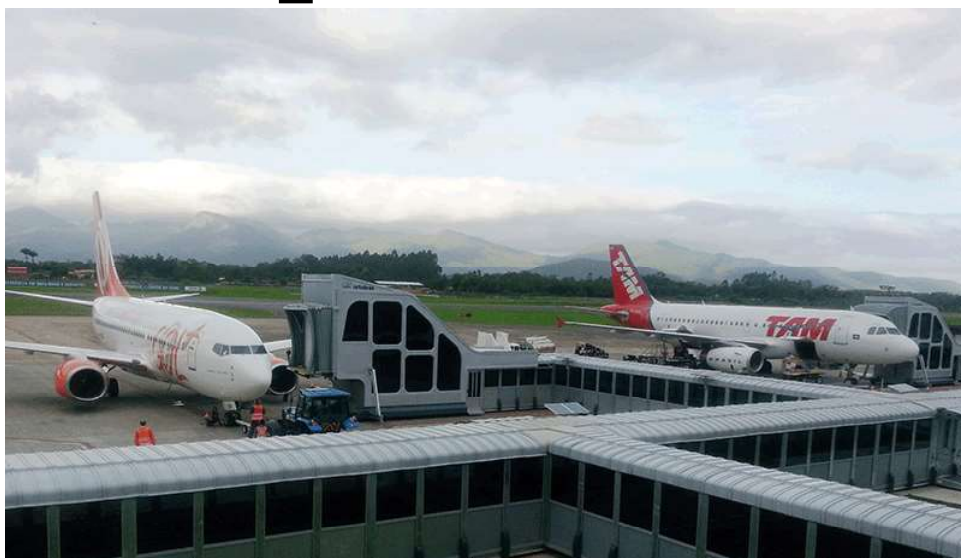
Poucos voos e preços absurdos das passagens no Aeroporto de Porto Velho

Há os que têm mais tempo, paciência e sem temor de enfren-