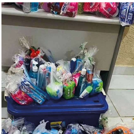
Os kits foram distribuídos entre as pessoas atendidas pelo Centro Pop

“A população em situação de rua, pelo estado de vulnerabilidade em que se encontra, está mais suscetível às infecções virais, daí a preocupação da Semasf em trazer logo a essa população a vacina contra a influenza, e para isso, tivemos o apoio da Agevisa/RO e da Semusa, órgãos aos quais agradecemos”, disse a co-