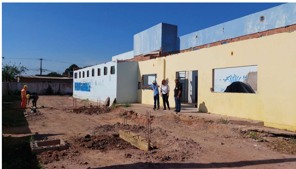
Unidade Três Marias tem previsão de entrega para abril de 2024

“Estamos trabalhando muito para cumprir o planejamento de reformas e ampliações das unidades de saúde. Muitas estão em execução, outras prestes a licitar com recursos garantidos. O próximo ano será ainda mais intenso com muitas entregas de unidades novas e também início de outras”, apontou a secretária.