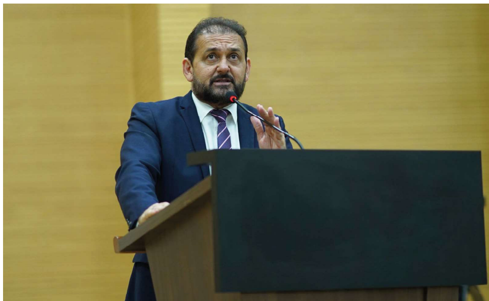
Indicação do deputado beneficia milhares de proprietários de motos abaixo de 170 cc

“Além da necessidade urgente do Governo Estadual atender o requerimento, encaminhando o projeto por meio da Casa Civil, para a votação em Plenário, é justo atentarmos para a questão social da proposta, uma vez que vivemos em um momento de grande desemprego e de sequenciais registros de encerra-