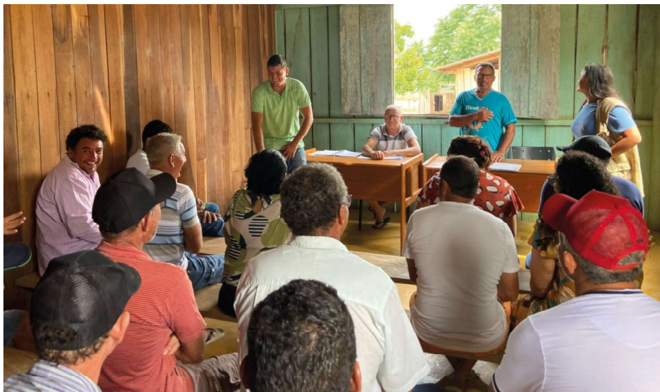
Objetivo de aproximar as entidades em prol do desenvolvimento econômico da capital

As demandas identificadas durante a visita abrangem diversas áreas, desde infraestrutura até questões sociais e ambientais. A deputada enfatizou sua intenção de levar essas preocupações ao cenário legislativo, buscando apoio e imple-