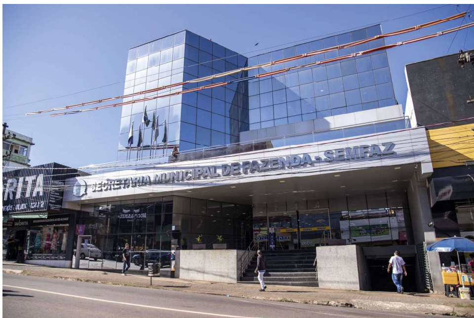
Atendimento na Secretaria de Fazenda do Município acontece em horário normal

A chegada da plataforma atende a um dispositivo federal de 2003 que prevê a integração e o compartilhamento de cadastros e informações fiscais entre as administrações tributárias da União, dos Estados e dos Municípios. A Semfaz também informa que para atualização de e-mails de acesso ao Portal de Emissão de Notas Fiscais de serviço eletrônico, contribuintes podem entrar em contato através do e-mail def.semfaz@portovelho.ro.gov.br ou pelos telefones (69) 98473-3160 e 98473-8267.