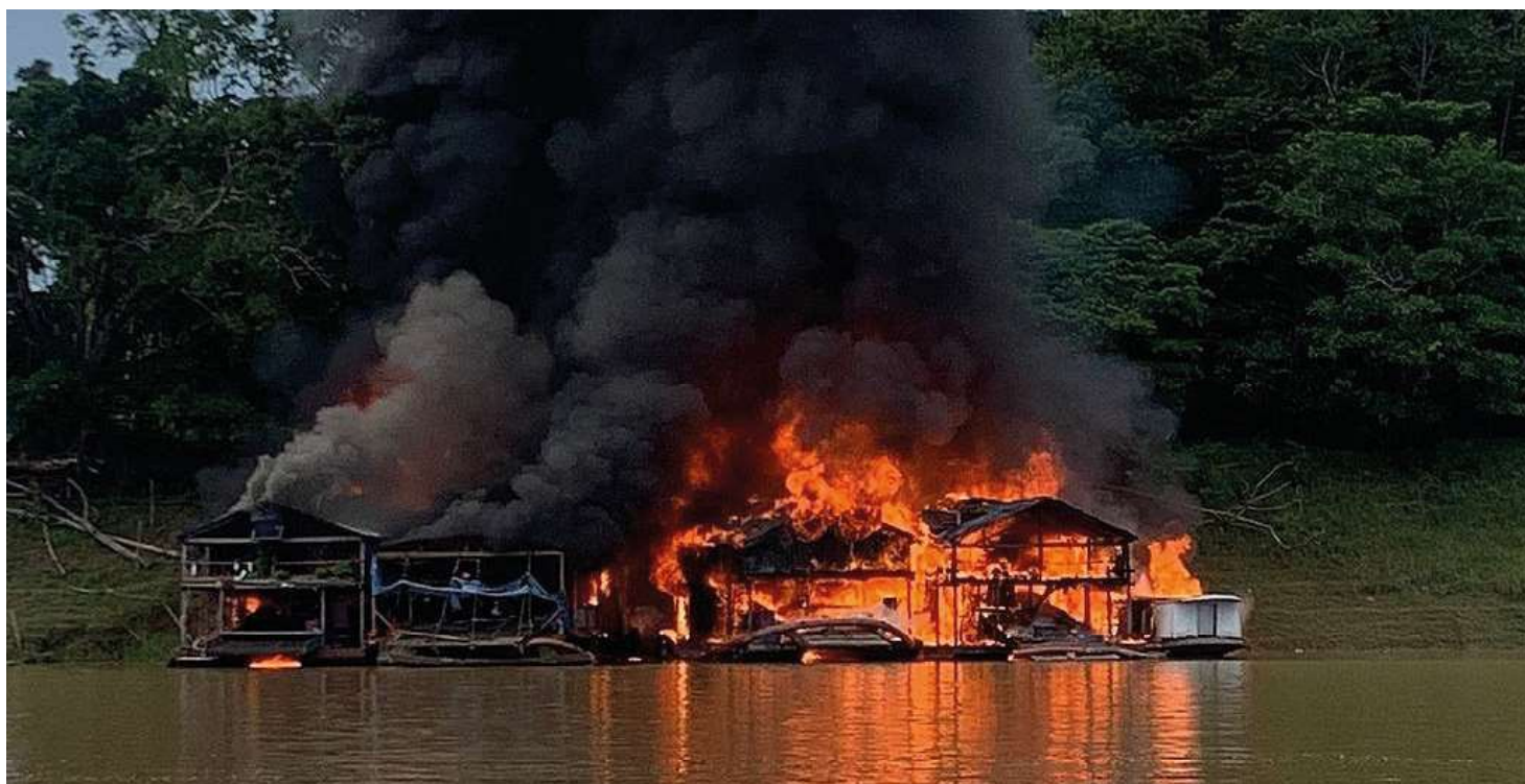
Ibama e Polícia Federal incendiaram mais de 100 balsas de garimpo no Rio Madeira na última semana