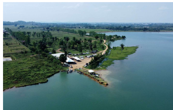
A ação foi realizada nas imediações do Alagado Pág. 07