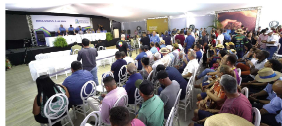
Sessão itinerante de Machadinho do Oeste Pág. 03