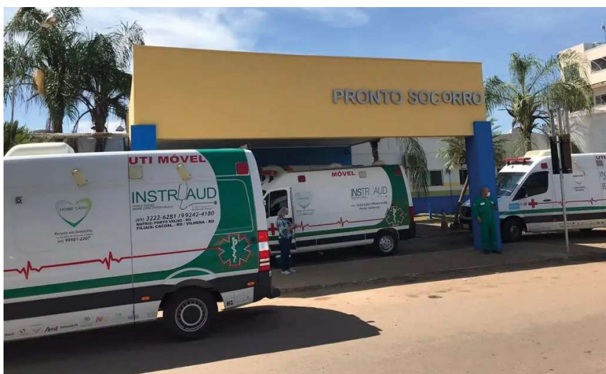
Fluxo de ambulâncias e viaturas da polícia é constante do João Paulo II Pág. 05

Número de acidentados em todo o estado faz com que o único hospital de Pronto Socorro de Porto Velho fique sempre lotado, com pacientes da capital, do interior, do Amazonas, do Acre e até da Bolívia na fila de cirurgias.