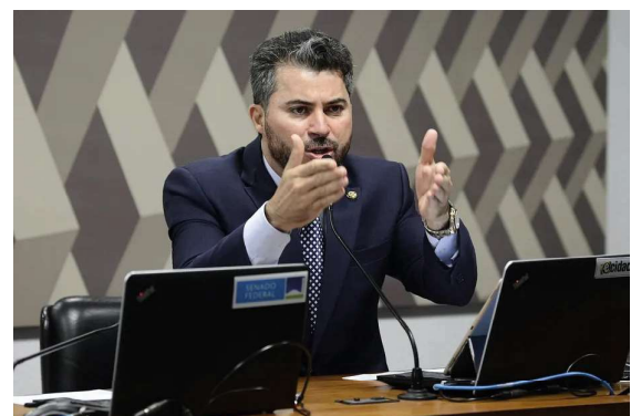
Senador rondoniense faz o contraponto da direita Pág. 05