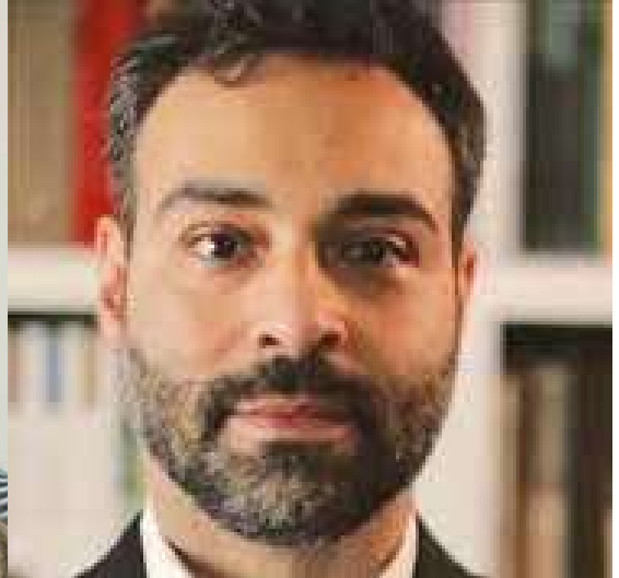
Empresária é a cara da direita enquanto que advogado é a cara da esquerda na capital

informa que as conversas entre o trio são quase diárias.